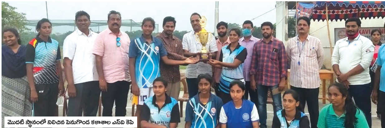
మొదటి స్థానంలో నిలిచిన పెనుగొండ కళాశాల ఎస్వి కెపి